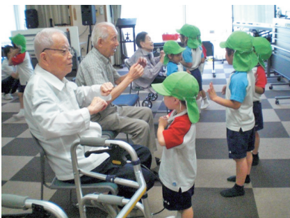
思わず体もよく動きます