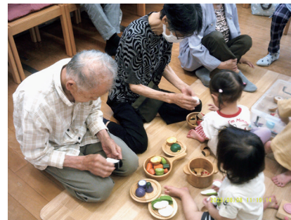
笑顔がこぼれる優しい時間

買物中、利用者さんがスーパーの中で子どもを見ると笑顔で手を振られる姿、立ち止まって話し掛けられる姿をよく目にするので、ゆっくりと子ども達と過ごせる機会がで