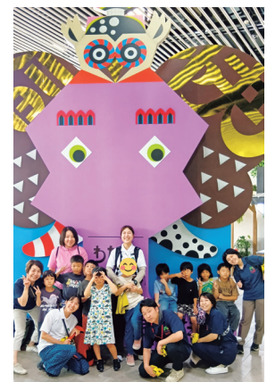
楽しかった夏の思い出

シエル開設後、初めての夏休みを迎え、子ども達が楽しめる「お出かけイベント」を実施しました。行先は吹田市に「生きているミュージアム・ニフレル」。当日は9名の子ども達が参加し、朝は博愛の園でラジオ体操に取り組み、シエルでお弁当を食べながら出発しました。到着が近づく子ども達は期待で胸をふくらませ、館内ではワークシ