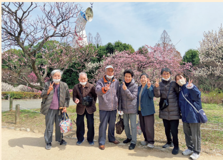
みんな揃ってピース満開!