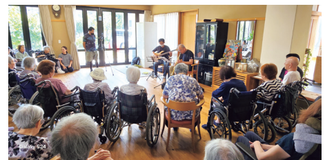
心と体に響きます