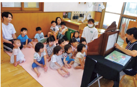
紙芝居が大好きな子どもたち

博愛社後援会会費 ▽個人 1口 3千円 ▽法人 1口 1万円 いずれも年会費で、 期間は4月～翌年3月 ▽郵便振替口座番号 0092074676 ▽口座名義 社会福祉法人 博愛社