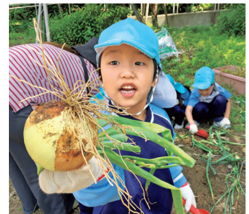
大きな玉ねぎ採れたよ