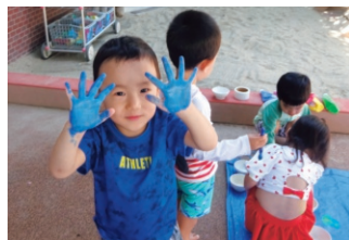
みてみて～おててあおいろ～