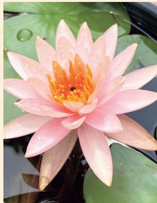
心を和ませる睡蓮

今年の春に念願の睡蓮を購入しました。かわいい花が次々と咲いてくれ、ホームの前を通る方も楽しみにしてくれており楽しく育てています。