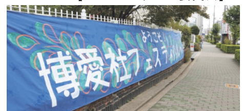
オール博愛社で開催します！

今年度の博愛社フェスティバルは10月20日（日）に開催します。昨年度が盛況に終わり、益々盛り上げたい思いから今年度は法人全体でフェスティバルを盛り上げるため4月から委員会が準備に当たっています。