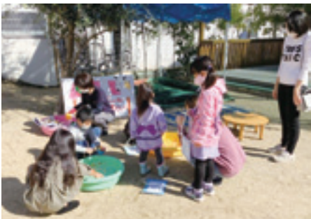
懐かしいあの頃に戻って

今年度はコロナ禍の中でもどうか開催することは出来ないかと、いろんな案を提案しながら話し合いを繰り返して、保護者の方とも繋がっていた気持ちから、10月30日（土）