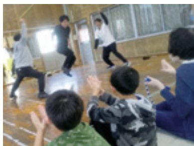
ダブルダッチのイベントの開催!

電車大好きM君は紙と鉛筆、定規があれば完成度の高い電車のクラフト作品を仕上げます。1台1台電車にも顔があり、彼の愛情が詰まった作品は親友です。小学生から通っている彼も、この3月で高校とともに『わくわく』も卒業