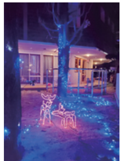
幻想的な雰囲気のごども園

「博愛社グランドデザイン2020」にはプロジェクト3本柱があり、そのうちの一つ「笑顔になれる場所拡大プロジェクト」に「冬のイルミネーション」があります。以前から12月になると本館のマリア像の壁面にイルミネーションが施されており、今年からは博愛社こども園の正門付近においても新たに追加されました。 「博愛社グランドデザイン2020」にはプロジェクト3本柱があり、そのうちのひとつ「笑顔になれる場所拡大プロジェクト」に「冬のイルミネーション」があります。以前から12月になると本館のマリア像の壁面にイルミネーションが施されており、今年からは博愛社こども園の正門付近においても新たに追加されました。 寒さを吹き飛ばすようなきらびやかな光を見て、子ども達は大喜びでした。こひつじ乳児保育園でも同じく実施され、笑顔が生まれていました。春には、正門からの「桜の通り抜け」を予定しており、地域の方々に博愛社自慢の桜通りを愛でていただければと企画中です。【川田 誠】