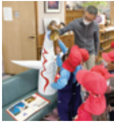
遠足を思い出しながら観察

秋晴れの中、指折り数えて楽しみにしていた遠足に行ってきました。子ども達の目にもまずとまったのは、大きな太陽の塔でした。「大きいね」「ちよっとこわいね」「なんで顔2つあるん？」と思いに話していました。園内の各地に遊び場があり、ドングリや綺麗な落ち葉を拾いながら散策した子ども達のお散歩バッグはパンパン！金色の落ち葉のシャワーに、葉っぱで作るお面：沢山の秋の自然に触れました。見上げるほどの大きな遊具