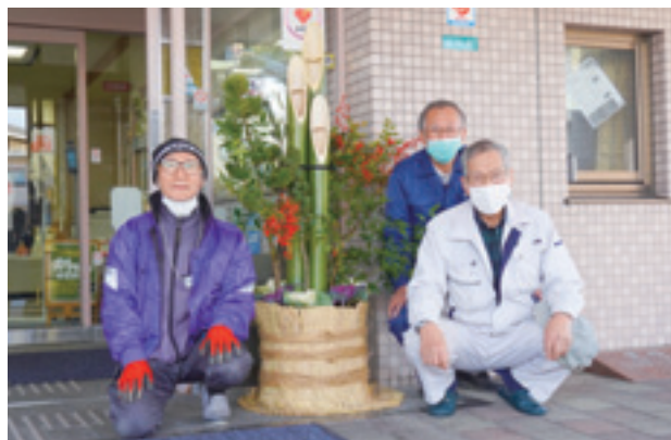
手際よく3人で門松を制作

す。 また、現在サルビアさんは、メンバー募集されています。それに伴い、門松づくりの様子を密着して募集動画を作りました。博愛社のホームページの「お知らせ」からリンクして頂きます。是非ともご覧いただければ幸いです。 【坂本 康一朗】