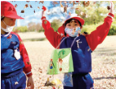
落ち葉のシャワー

園内の各地に遊び場があり、ドングリや綺麗な落ち葉を拾いながら散策した子ども達のお散歩バッグはパンパン！金色の落ち葉のシャワーに、葉っぱで作るお面：沢山の秋の自然に触れました。見上げるほどの大きな遊具