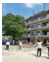
夏空の下でみんな一緒にラジオ体操