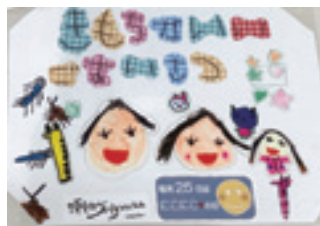
笑顔で「きもちがいいごあいさつ」

▽個人 1口 3千円 ▽法人 1口 1万円 博愛社後援会会費 ▽期間はずれも年会費で、 ▽郵便振替口座番号 4月～翌年3月 092074676 ▽口座名義 博愛社 社会福祉法人