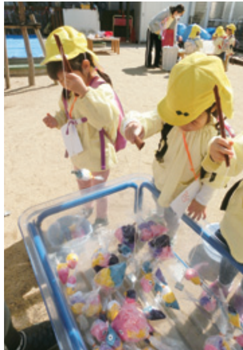
真剣な眼差しで魚釣り

で制約の多い生活を強いられる子ども達に、少しでも良い思い出を作りたいと思いを込めて、まん延防止等重点措置期間であれば、キャンプに行くことが認められ、事前に準備を進めていました。しかし、8月2日に緊急事態宣言が発令され、予定していたキャンプはほぼ中止。7月中にキャンプに行けたホーム