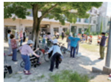
お年寄りは木陰で体操