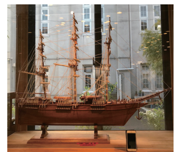
威風堂々たる姿（右下はスマホ）