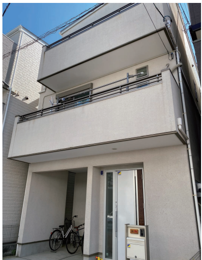
リフォームしてきれいなおうち