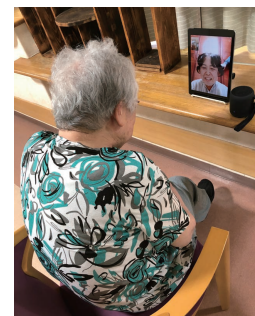
オンライン面会の様子

【保育事業】 行政方針に基づいて自園の「感染拡大防止マニュアル」を作成し、それに沿い防疫に努めました。その内容は、園児や職員の検温等体調管理、施設内消毒、来園者への対応、家庭保育の協力依頼などです。早く「3密」を気にせず過ごせるようになりたいです。