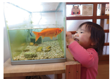
どんなお話をしてるのかな？

「おはよー。」自然と声をかける子ども達。金魚の存在が、子どもにとつても職員にとつても心がほつこりする場になつています。