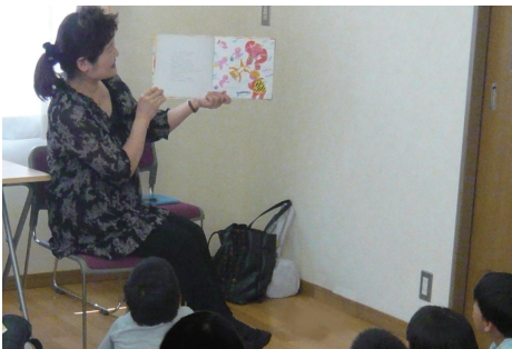
『トマトさん』の読み聞かせ