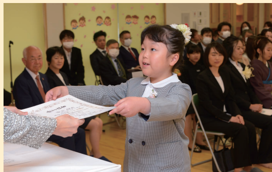
ご卒園おめでとう！